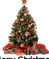
Merry Christmas Dec. 25