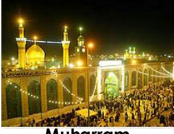
Muharram Dec. 17