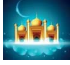
Bakrid 27 th October