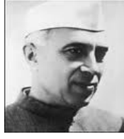
Children's Day 14 th November