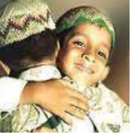
Bakrid 6 th November