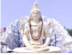
Mahashivarathri 07 th March