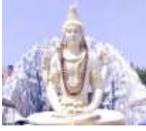
MAHASHIVARATIRI 27 th FEBRUARY