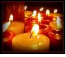
CANDLEMAS DAY 2 nd FEBRUARY