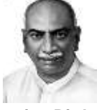
Kamarajar Birth Day 15 th JULY